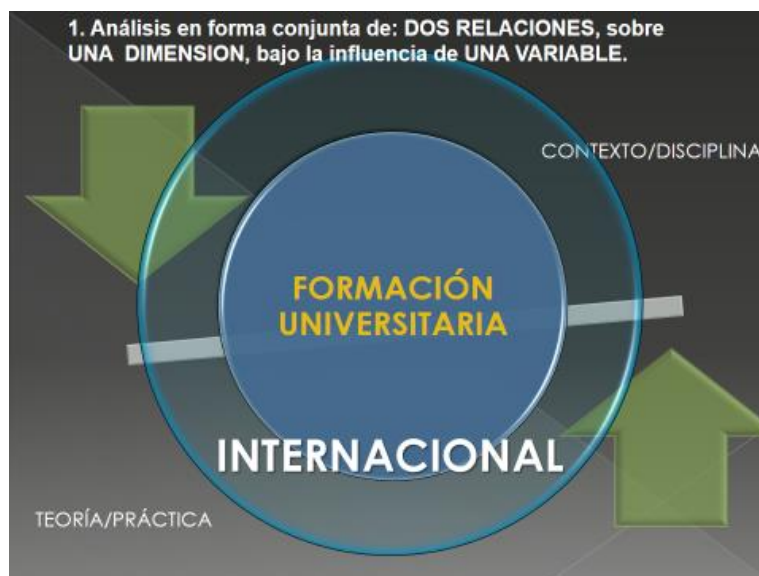
Fig. 2

Tal como puede verse en el gráfico, en este primer análisis se consideran en forma conjunta de: dos relaciones, sobre una dimensión, bajo la influencia de una variable.