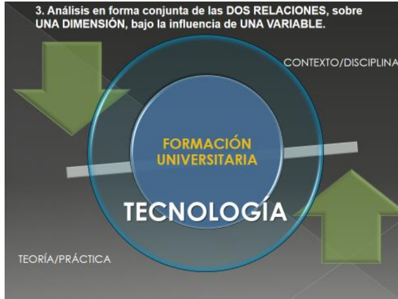
Fig. 4

La formación académica del contador público ha incorporado asignaturas referidas a las tecnologías de la información desde que éstas irrumpieron masivamente en la sociedad y tal vez con anterioridad, desde el uso de las computadoras como herramienta de procesamiento de datos para la obtención de información por parte de las organizaciones.