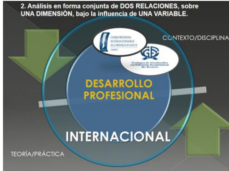
Fig. 3

Fue un hallazgo del proyecto encontrar que la Comisión Comercio Exterior y Mercosur en el Consejo de Profesionales de Ciencias Económicas, hacía más de dos años que se encontraba sin sesionar.