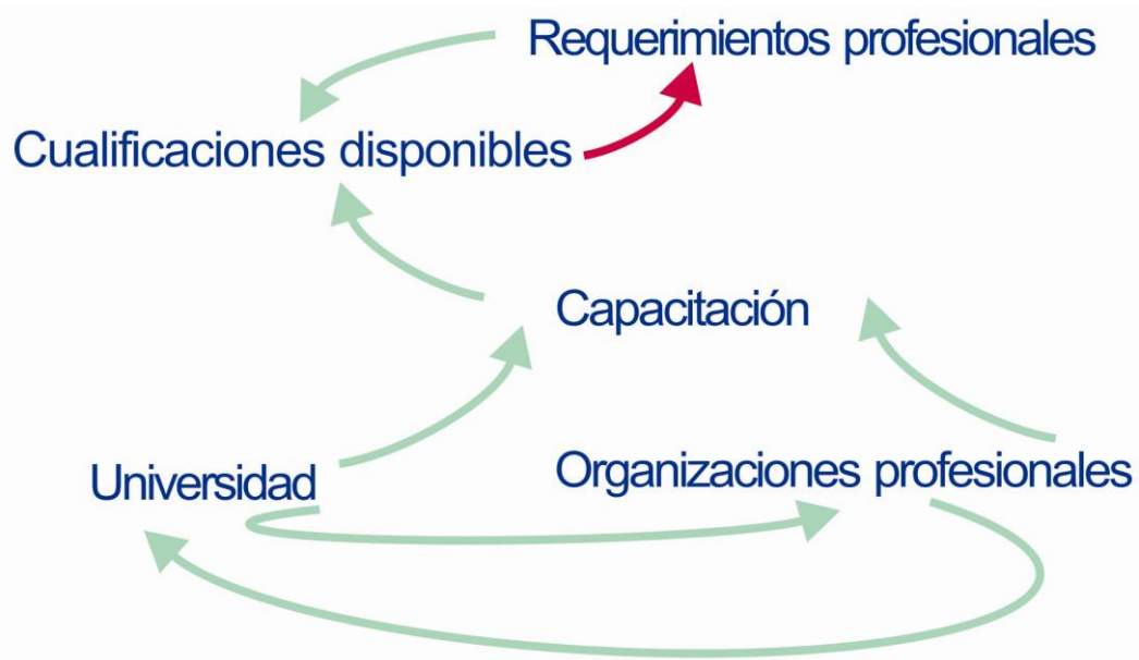
Cuadro N°1

Cabe entonces preguntarse si existe coincidencia entre lo que las organizaciones solicitan de los profesionales en cuanto al desarrollo de sus actividades laborales, y la capacitación recibida.