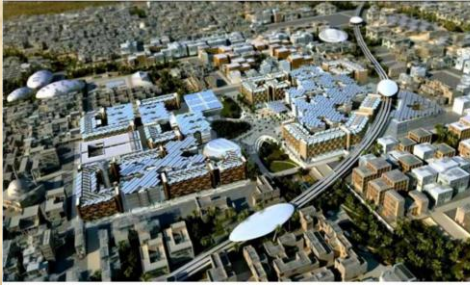
MASDAR INSTITUTE, ABU DHABI