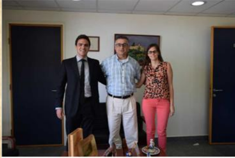
UNIVERSITÉ SAINT-JOSEPH (RECTORADO)

REPÚBLICA LIBANESA Al-Īumhūriya Al-Lubnāniya' الجمهورية اللبنانية