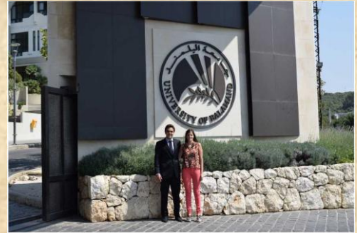
UNIVERSITY OF BALAMAND (RECTOR)